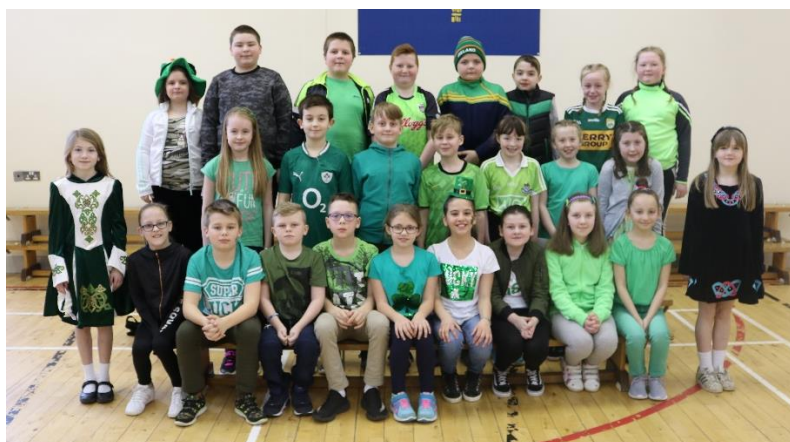
Klasa pana C. Killough podczas ostatniego apelu opowiedziała nam o Św. Patryku.

Proszę zauważyć, że następny rok szkolny rozpocznie się wcześniej, 30-go sierpnia, dla klas 2-7. Klasy 1-sze rozpoczyna rok szkolny w poniedziałek 3-go września. Pomoże nam to w organizacji dni wolnych w trakcie roku szkolnego, biorąc pod uwagę fakt, że 1-szy września wypada w sobotę, a 30-y czerwca w niedzielę. Pełna lista dni wolnych na przyszły rok dana będzie wkrótce.